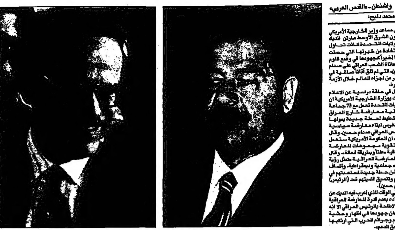
مارتن انديك وزير الخارجية الإيراني

واشنطن - قال مساعد وزير الخارجية الأمريكي لشؤون الشرق الأوسط مارتن انديك في بيان صحفي صادر عن مكتبه في واشنطن، إن المعارضة العراقية عاجزة عن اطاحة صدام حسين الذي لم يلق أيًا من أهدافه خلال الأربعة عشر عامًا من الجهاد المسلح. وقال انديك في بيان له: «المعارضة العراقية عاجزة عن اطاحة صدام حسين الذي لم يلق أيًا من أهدافه خلال الأربعة عشر عامًا من الجهاد المسلح». وأضاف: «لقد فشلت المعارضة العراقية في تحقيق أهدافها خلال الأربعة عشر عامًا من الجهاد المسلح». وأكد: «لقد فشلت المعارضة العراقية في تحقيق أهدافها خلال الأربعة عشر عامًا من الجهاد المسلح».